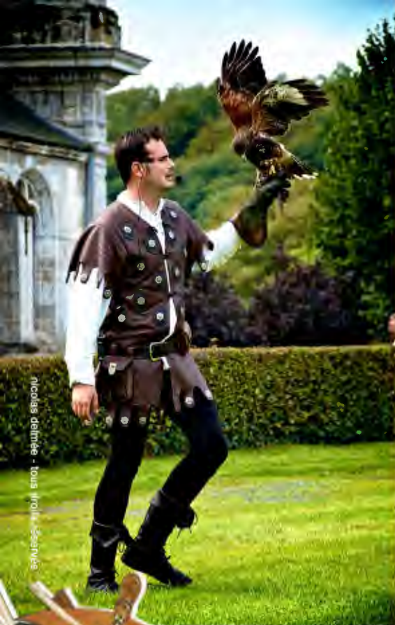
Nicolas de la Roche - tous droits réservés