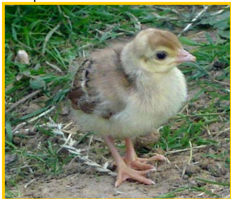
paonneton le 19 juin

Cette année, pour la première fois depuis leur arrivée au parc animalier, notre couple de paons bleus a donné naissance à trois petits. Malheureusement de la fratrie n'a survécu qu'un petit que nous vous présentons aujourd'hui :